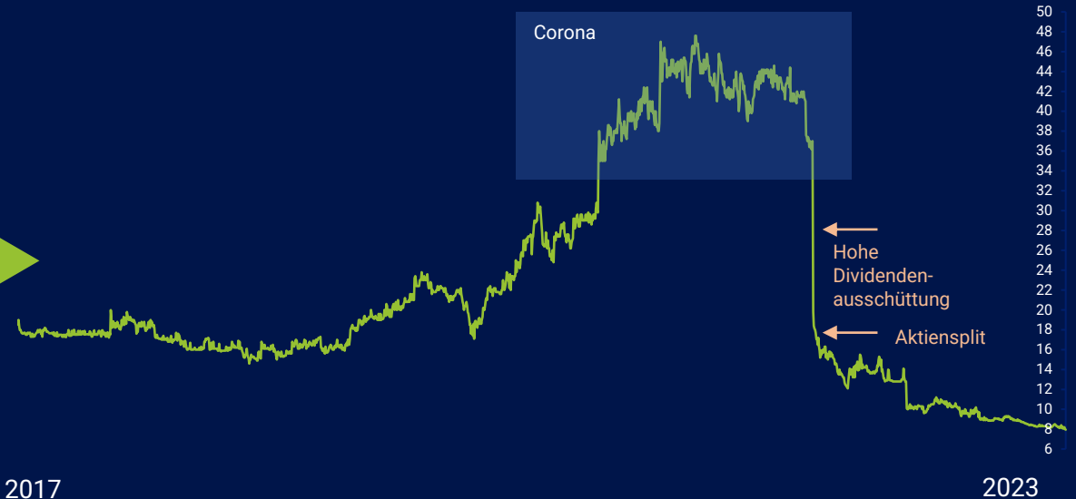
Kursverlauf der Aktie in EUR (Börse Stuttgart vom 15.05.2017 – 08.11.2023)

Seit Mai 2017 ist die tick Trading Software AG an der Börse Düsseldorf notiert